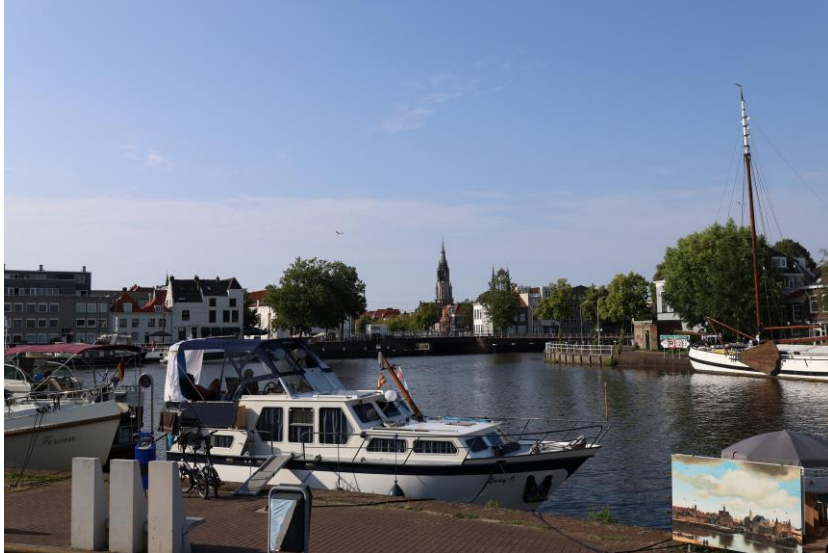
Het huidige 'Gezicht op Delft'.

Het EPW heeft oog voor onze culturele geschiedenis en 'Zicht op Delft' van Vermeer is een belangrijk visitekaartje. Het moet een grote teleurstelling zijn voor bezoekers, die speciaal daarvoor naar Delft zijn gekomen, dat die hoek van de stad ernstig is verwaarloosd en nauwelijks gelijkenis meer vertoont met het schilderij.