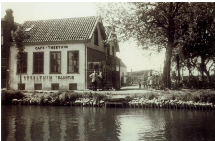
Café 't Haantje omstreeks 1955

Na ontvangst in het buurthuis De Drassige Driehoek ging de excursie van start langs de Kerstanjewetering, de grens tussen Delft en Rijswijk. Eerst langs twee fraai gerestaureerde boerderijen: Breedam uit 1863 en Veelzicht uit 1860; het boerenbedrijf en het boerenland zijn al lang verdwenen. Ook de tuinderijen in dit gebied zijn verdwenen om plaats te maken voor de bouw van Rijswijk Buiten. De tocht voerde verder naar de watertoren uit 1911, gebouwd door de voormalige gemeente Hof van Delft. De watertoren is van gewapend beton, nieuw voor die tijd. Langs een klein volkstuincomplex en de speeltuin keerde de groep terug naar het buurthuis en werd de excursie afgesloten met koffie en thee.