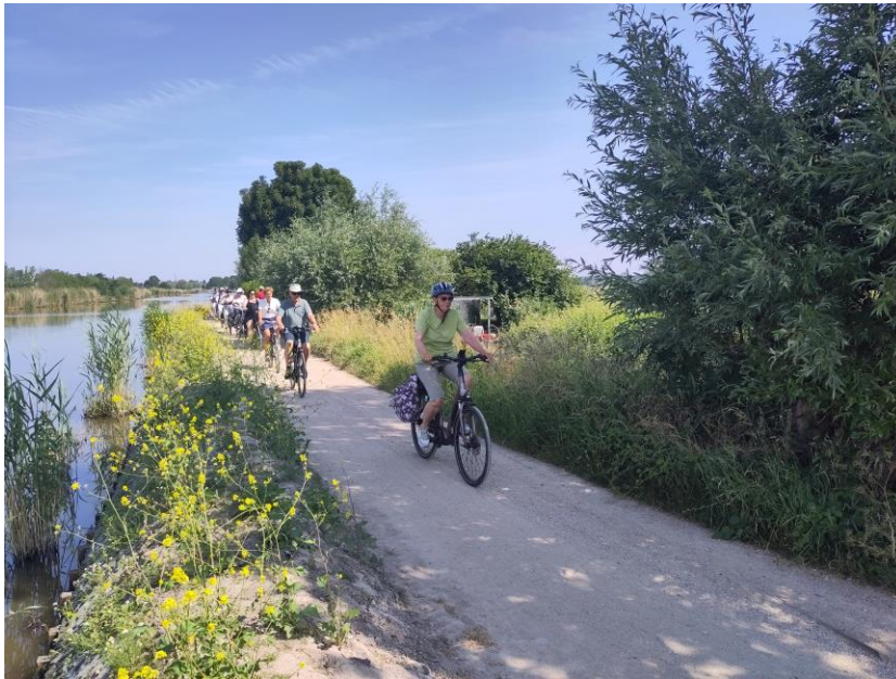
Tijdens de fiets- en wandeltocht vorig jaar

In restaurant Het Raadhuis in Schipluiden kregen de deelnemers een streeklunch, waarna . één groep met een gids ging wandelen door Schipluiden. De andere groep ging met een gids fietsen naar de in 19e-eeuwse stijl gerestaureerde boerderij Abbestee. De fietstocht voerde tenslotte via de gotische kerk aan de Vaart naar De Levende Buitenplaats aan de Tramkade, waar allerlei activiteiten in het kader van de Midden-Delflanddag plaatsvonden.